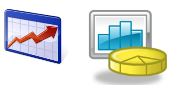
例) 推移 店舗比較